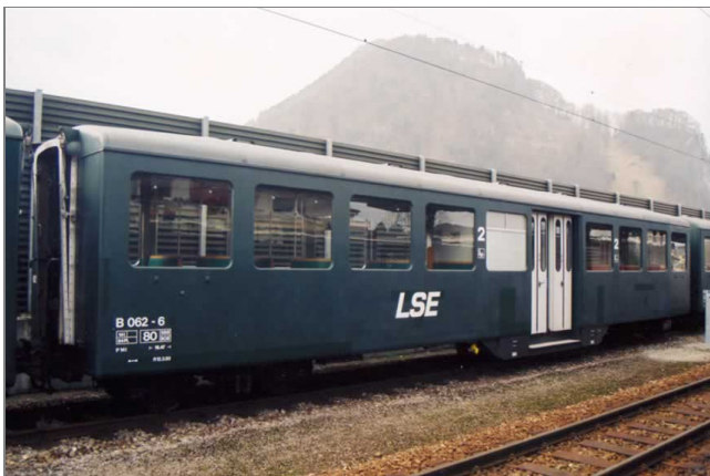
Originalwagen B 062-6