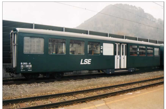
Originalwagen B 063-4