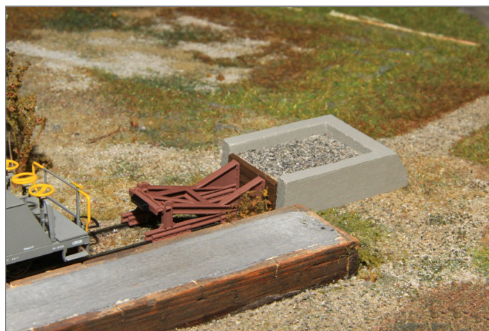
Zur Ausgestaltung der Anlage oder als Ladegut.