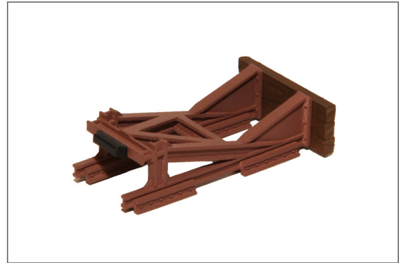
Artikel 2650 004 000