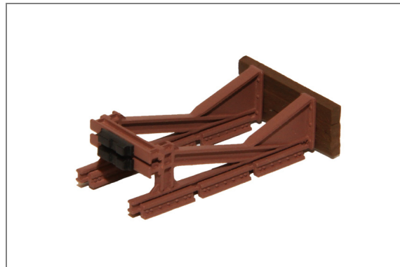
Artikel 2650 003 000