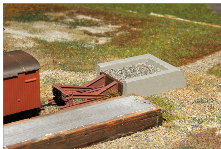
Zur Ausgestaltung der Anlage oder als Ladegut.