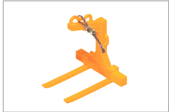
Artikel 2617 014 000-51