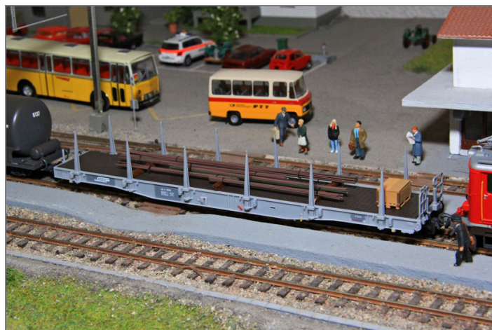
Zur Ausgestaltung der Baustelle oder als Ladegut.