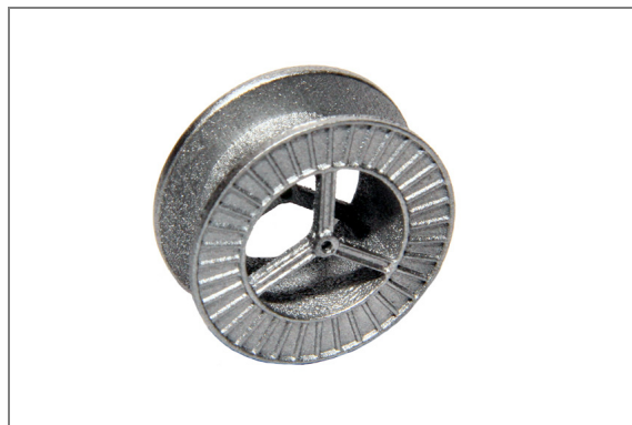
Artikel 1660 002 000-57