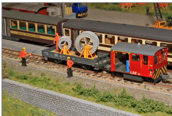
Zur Ausgestaltung der Baustelle oder als Ladegut.