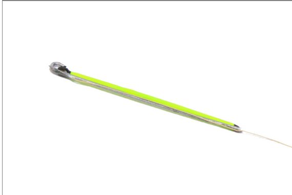
Artikel 1650 058 000-11