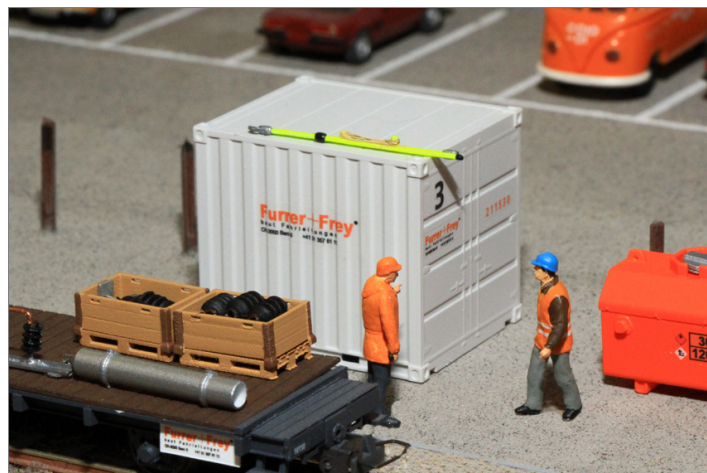
Zur Ausgestaltung der Anlage.