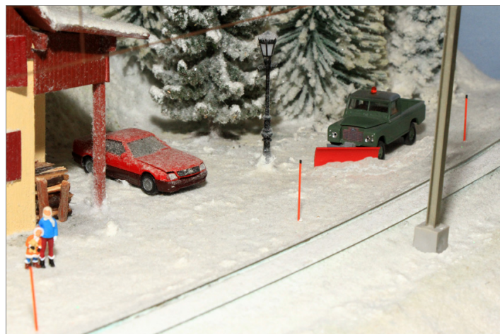
Zur Ausgestaltung der Anlage.