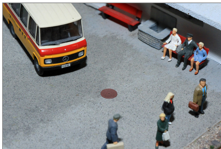
Zur Ausgestaltung der Anlage oder als Ladegut.