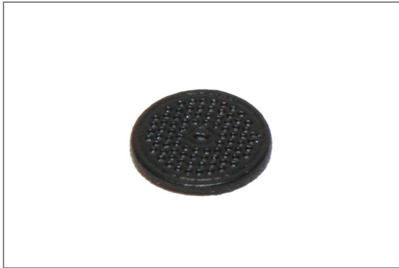
Artikel 1650 051 000-55