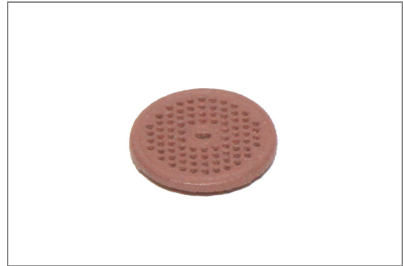
Artikel 1650 051 000-56