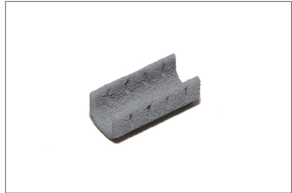
Artikel 1650 044 000-57