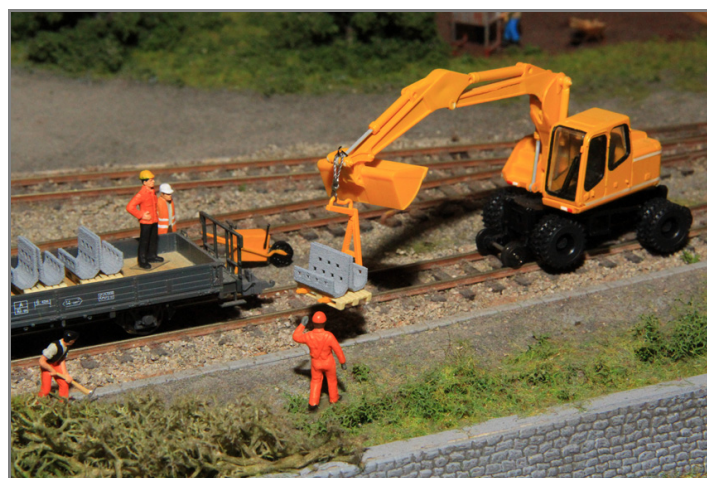
Zur Ausgestaltung der Baustelle, als Ladegut oder zum Einbau ins Diorama.