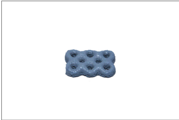
Artikel 1650 043 000-57