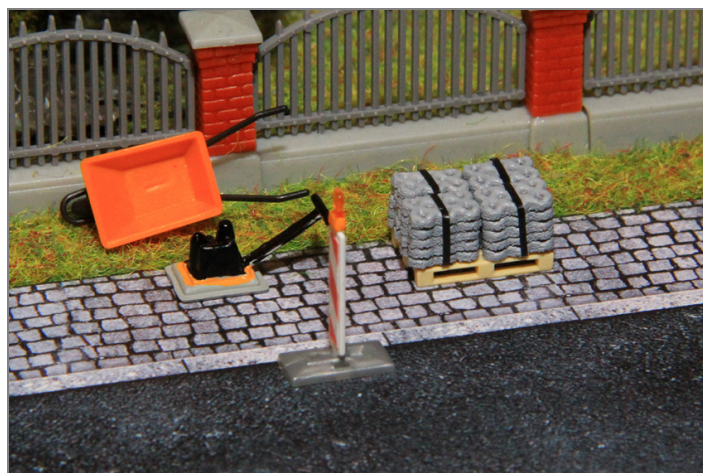
Zur Ausgestaltung der Baustelle, als Ladegut oder zum Einbau ins Diorama.