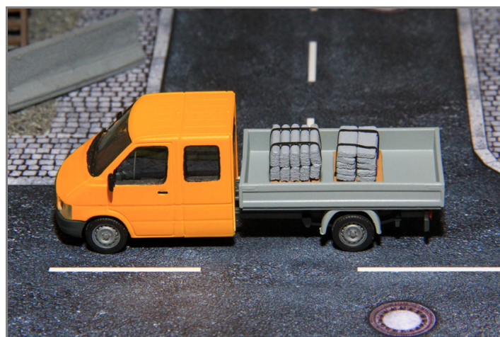
Zur Ausgestaltung der Baustelle, als Ladegut oder zum Einbau ins Diorama.