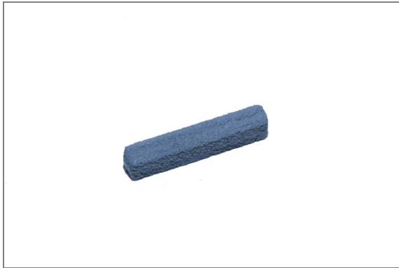
Artikel 1650 040 000-57