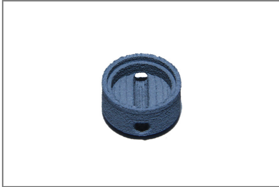
Artikel 1650 022 000-57