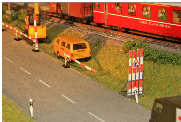
Vorsignalständer mit Verkehrszeichen.