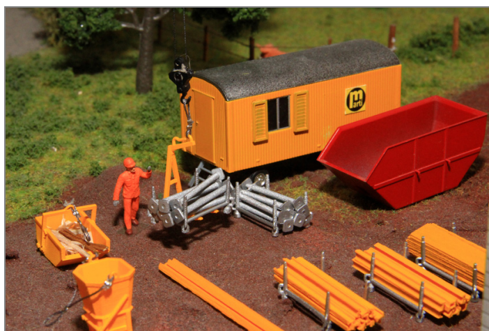
Transport-Barellen beladen mit den Deckenstützen, bereit für den Einsatz.