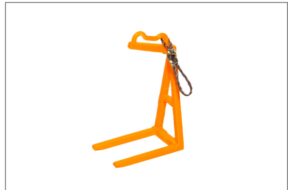
Artikel 1630 017 000-51