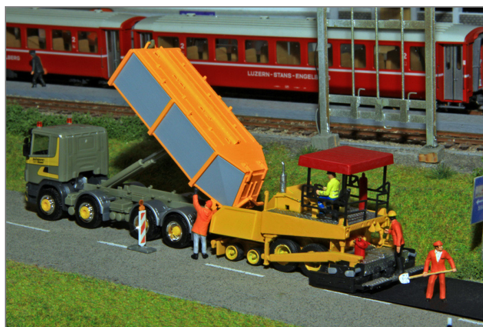
2-Kammerthermosilo auf einem 4achser Abrollkipper.