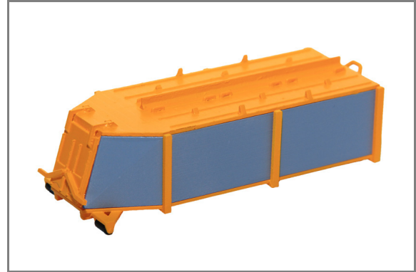
Artikel 1620 006 000-51