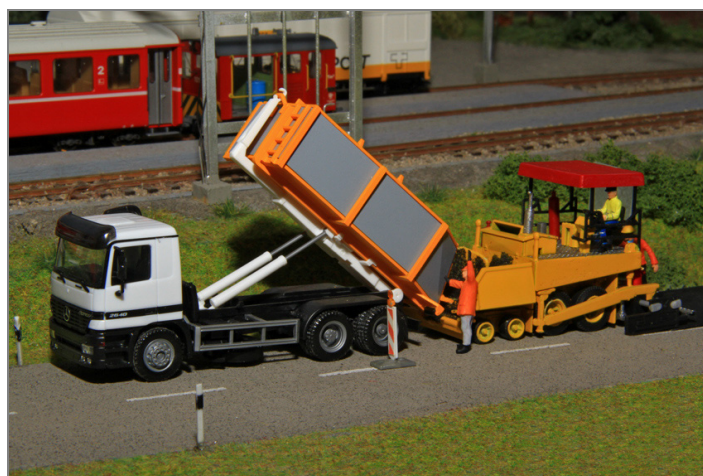
2-Kammerthermosilo auf einem 3achser Abrollkipper.