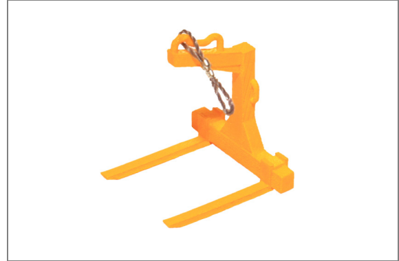
Artikel 1617 014 000-51