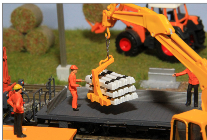
Palettengabel im Einsatz bei Lastwagen mit Ladekran oder auf Baustellen mit Baufahrzeugen.