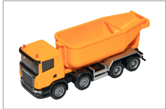
Artikel 1520 014 000-51