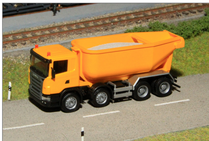
Aufgebaut auf einem 4achser-Fahrgestell. Ideal für jede Strassenszene oder Baustelle.