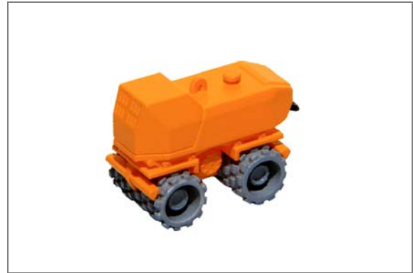
Artikel 1510 011 000-51