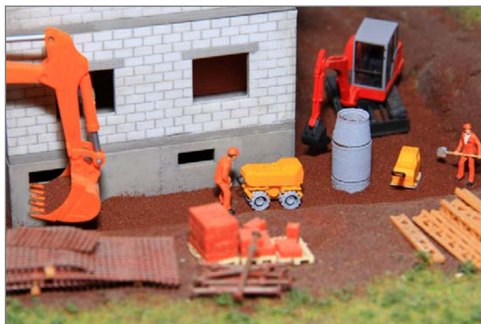
In den verschiedensten Baubereichen im Einsatz. Das ideale Ausgestaltungselement.